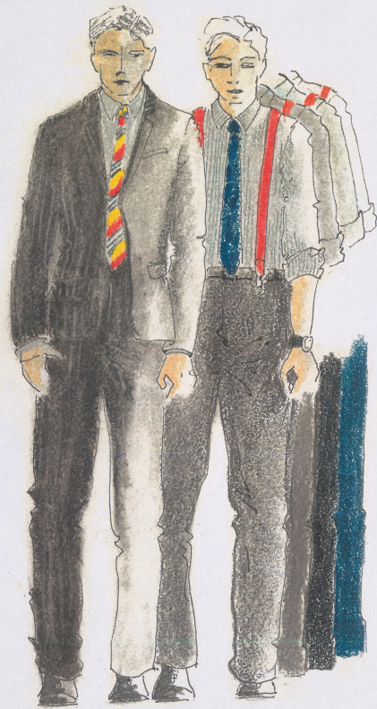
LEON - MŁODSZA CZĘŚĆ I AKTU. współczesna wersja