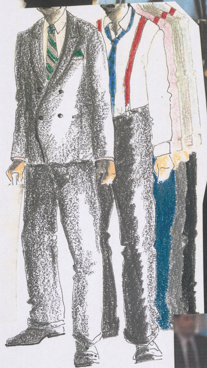
STARSZA CZĘŚĆ I AKTU