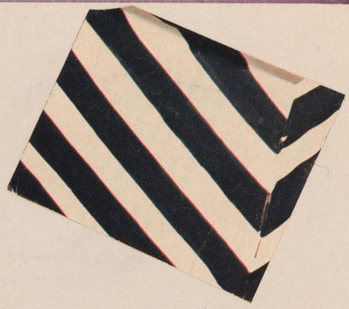
Fig. 1 na zielonym