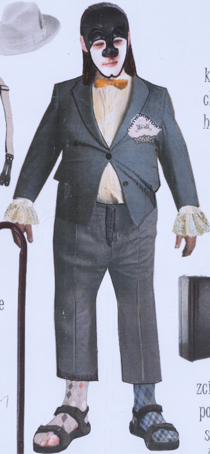
koronkowa chusteczka haftowana